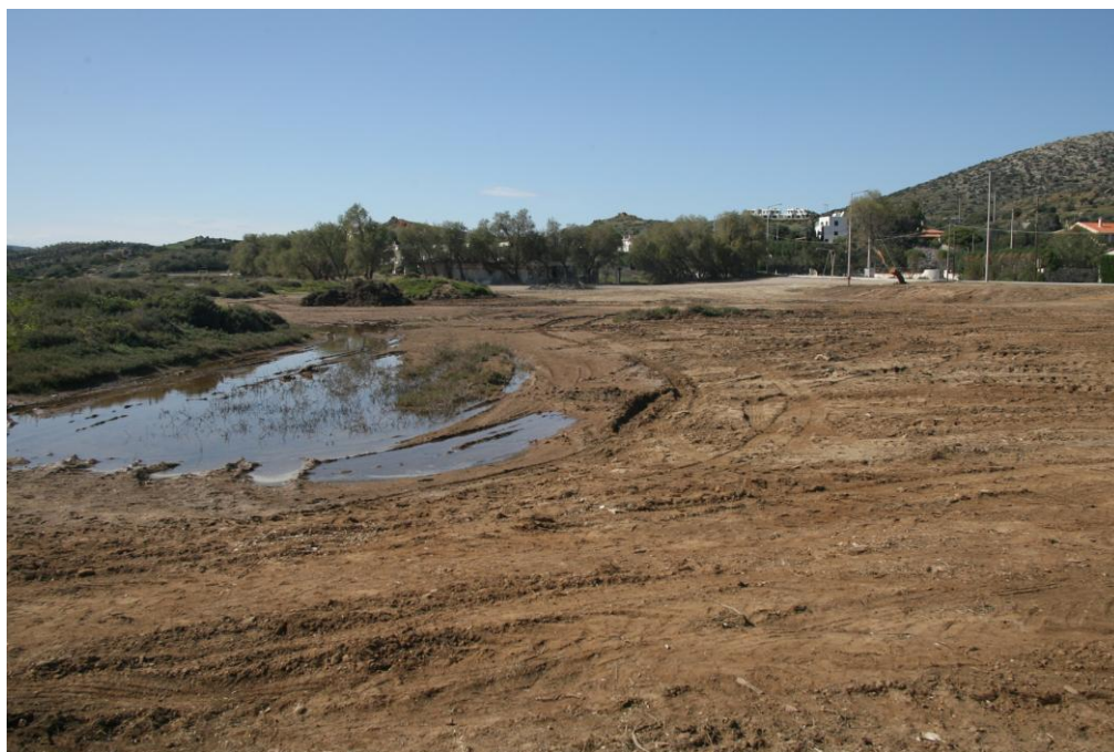
Φωτογραφία 1: Περιοχή εκχέρσωσης βλάστησης και επιχωμάτωσης πάνω από το λιμανάκι Λεγραινών.

Νίκης 20, 105 57 Αθήνα Τηλ: 210 3224944 Fax: 210 3225285 Email: info@eepf.gr Web: www.eepf.gr