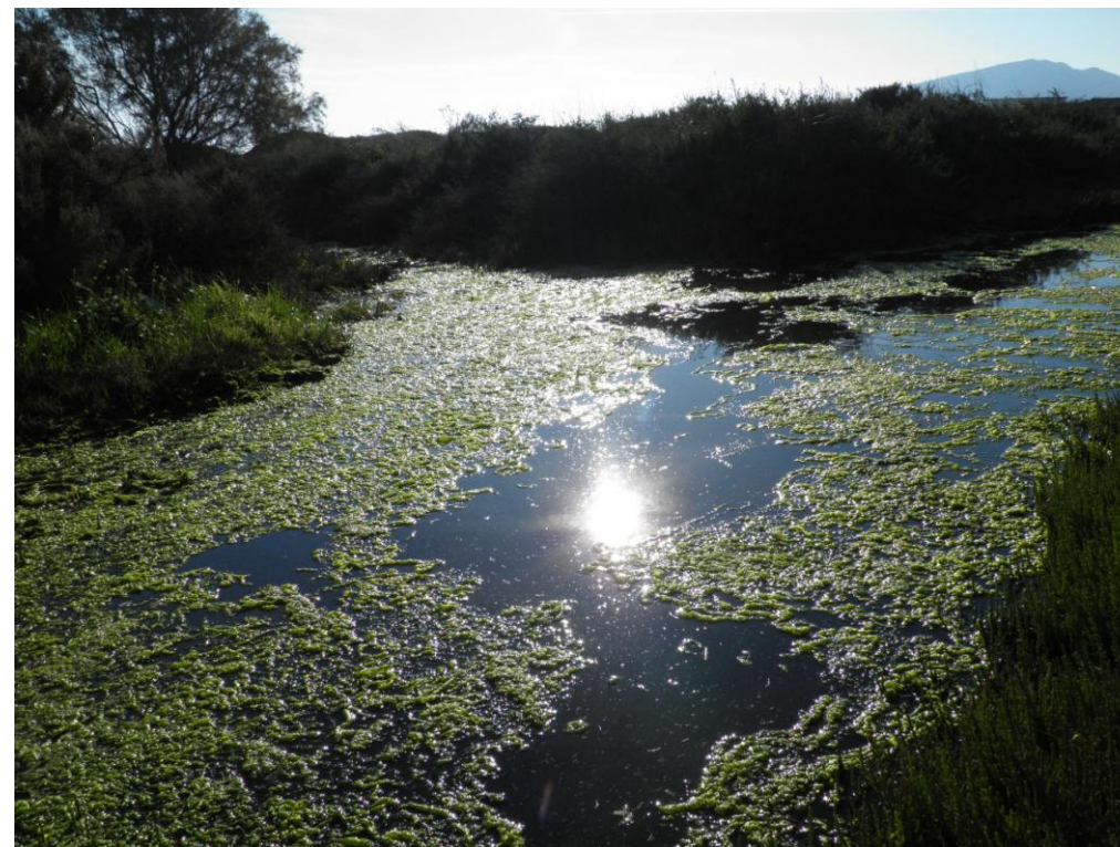
Φωτογραφίες 5-6: Ο παράκτιος Υγρότοπος Λεγραινών πριν την παρέμβαση (1/2/2016)