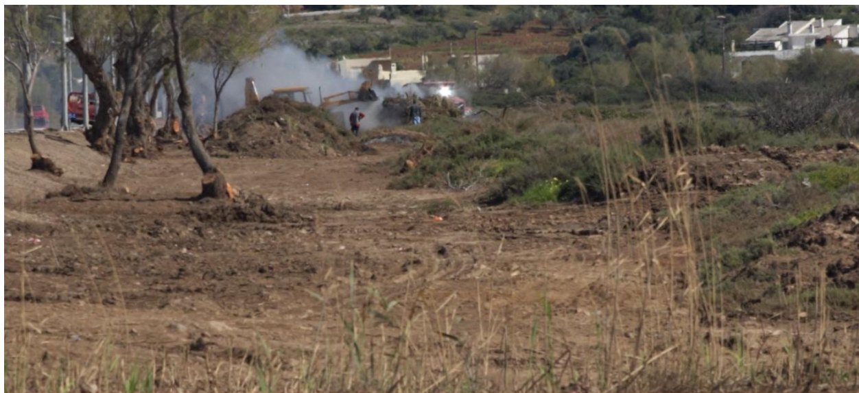
Φωτογραφία 3: Εργασίες καταστροφής του προστατευόμενου Παράκτιου Υγροτόπου Λεγραιών στις 3/3/2016. Διακρίνεται μπουλντόζα, φορτηγό και κόκκινο ημιφορτηγό του Αναπτυξιακού Συνδέσμου Λαυρεωτικής. Ο καπνός προέρχεται από τους καιόμενους σωρούς της εκχερσωμένης βλάστησης.