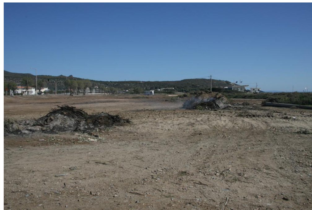
Φωτογραφία 2: Καϊόμενοι ανεπιτήρητοι σωροί εκχερσωμένης βλάστησης.