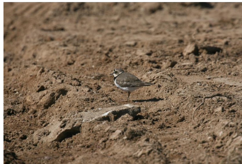
Φωτογραφία 4: Ποταμοσφυριχτής ( Charadrius dubius ) δίπλα στο λιμανάκι Λεγραιών.